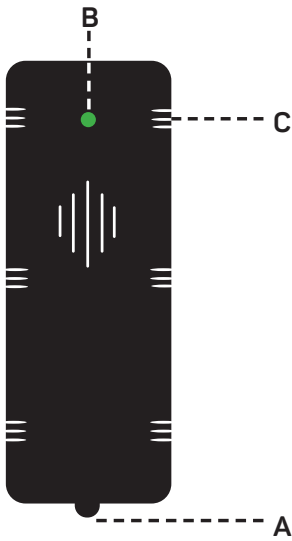
Skizze 1 Sketch 1